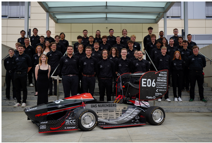
Das Formula-Student-Team der Technischen Hochschule Nürnberg besteht aus 60 Studierenden unterschiedlicher Fachrichtungen.